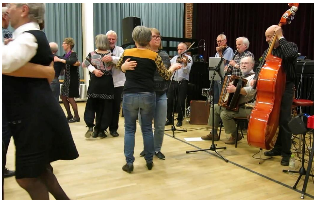
Fra dobbeltballet 2017.

Skulle vi også være så heldige, at der er nogen, som har lyst til at medvirke i laugets bestyrelse, så giv endelig besked til bestyrelsen eller mød blot op og deltag i debatten til generalforsamlingen.